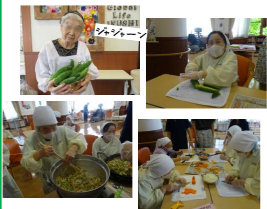
西日を遮るためにプランターに植えたゴーヤがぐんぐん成長し、料理レクが出来るほど収穫出来ました。メニューはゴーヤチャンプルと粉ねり。「苦いけど、美味しい」と皆さん大満足でした。