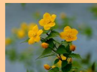
「やまぶきの花」 グローバルライフ生石にて

やまぶきは、春に咲く可憐な花です。花言葉は、「崇高」、気品が高いです。私達は、入居された方々のプライベートや尊厳を大切に生活をサポートしていきます。やまぶきを通じて皆様の活々とした暮らし、山吹色に輝く笑顔をお伝えします。