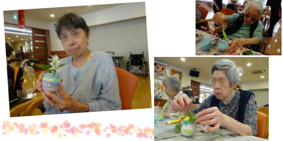
カラーサンドと造花でガラスサンドフラワー作りを。同じ材料ですが、個性豊かな出来栄になりました。